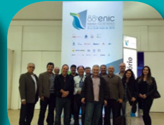
Paraná // 88º ENIC Encontro Nacional da Indústria da Construção