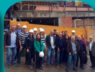
Rio Grande do Sul // Visita à Obra da Construtora Athiva Brasil