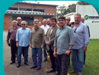
Rio Grande do Sul // Visita Unisinos